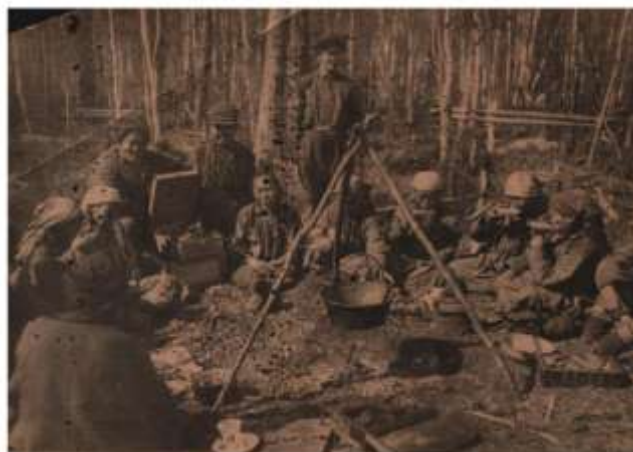
Оленеводы и чумработницы колхоза им. Ленина