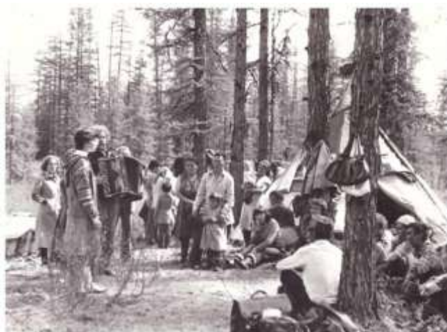
Агитбригада в Суриндинской оленбригаде, 1980г.

Байkitский сельский Совет депутатов поздравляет коллектив МКЦ «Новое поколение»