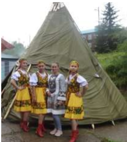
Танцевальная группа Рябинушка детского сада Олененок